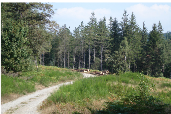
Document réalisé dans le cadre du Contrat de Filière «AGIR pour la forêt et la filière bois en Languedoc-Roussillon», grâce au soutien financier de :

Soutenir les entreprises d'exploitation forestière et de mobilisation des bois dans leurs investissements pour qu'elles puissent développer leurs activités dans le respect de l'environnement, accroître leur productivité et pouvoir répondre dans de bonnes conditions aux attentes du marché.